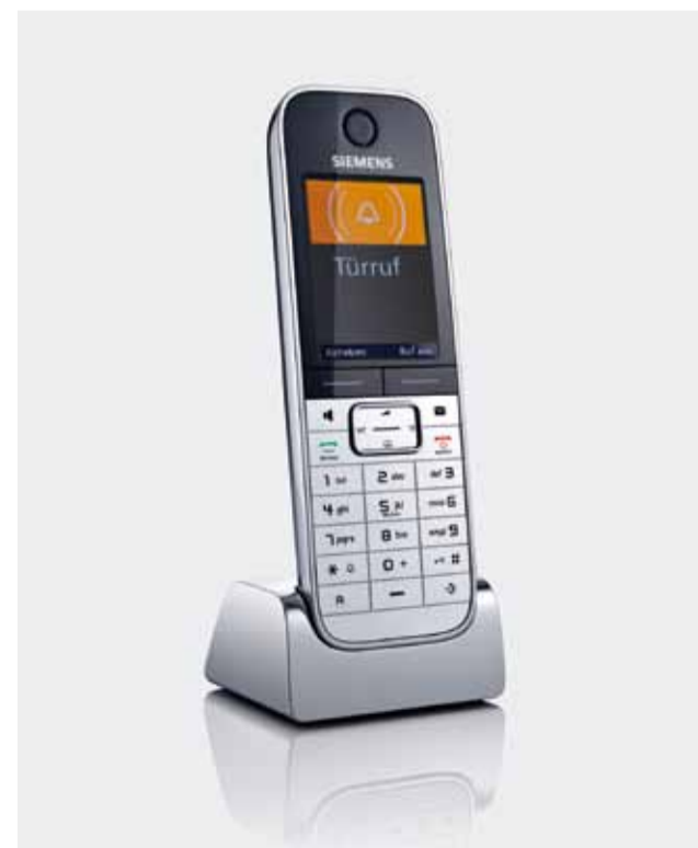
Siedle DoorCom: die Verbindung von Tür und Telefon

Mehr zu diesem Thema unter www.siedle.de/tk