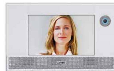
Anschluss an das Wohnen der Zukunft: Bedienpanels werden zur Innensprechstelle der Türkommunikation (im Bild: Displays von Crestron und AMX).