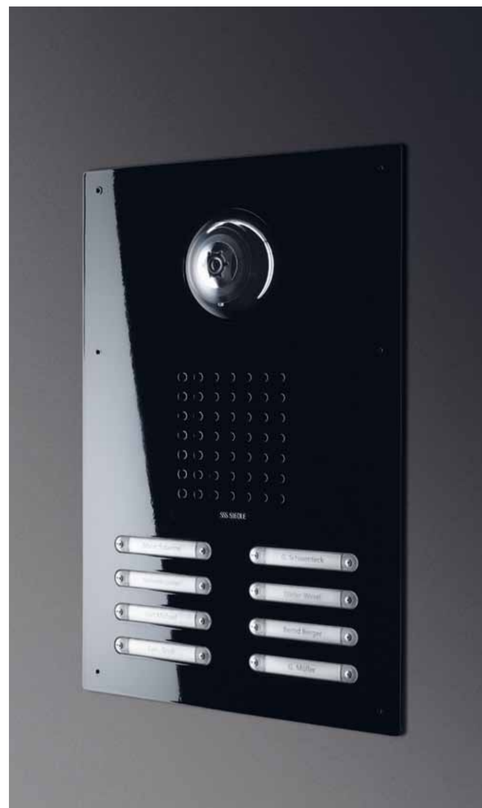
Video-Türstation in schwarzer Hochglanzlackierung.

Speziell für den Ersatz von Türstationen der Baureihe TL 111 entwickelt: eine Variante der aktuellen Produktlinie Siedle Classic.