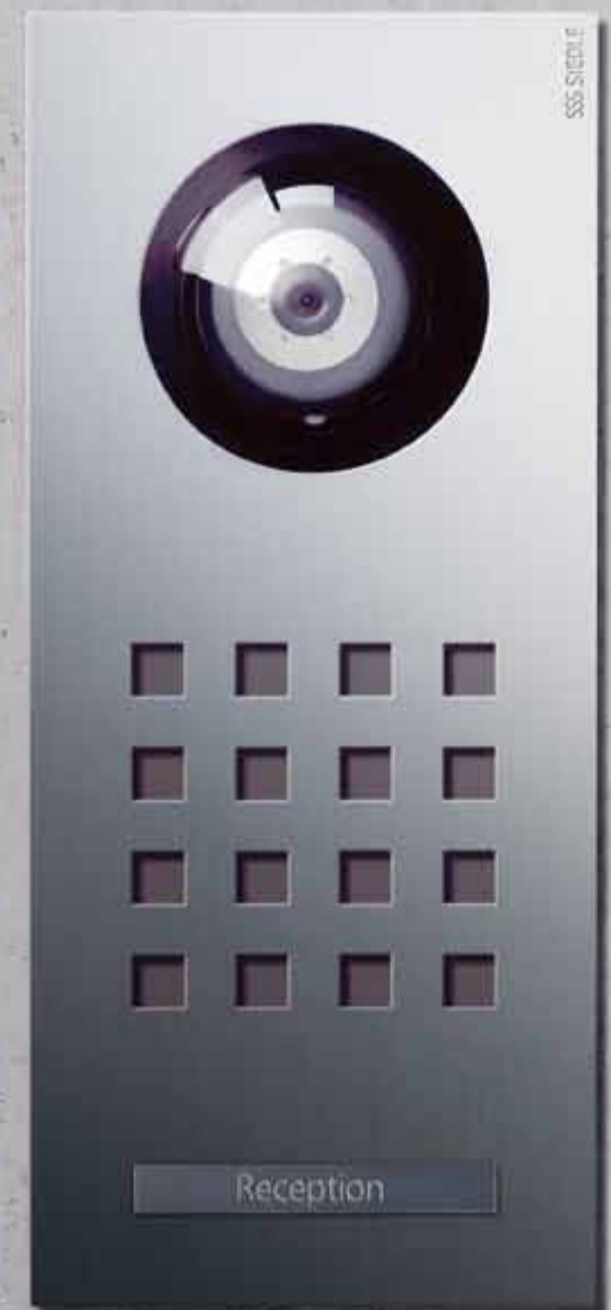
Türstation Siedle Steel mit Videokamera, Sprechsystem und Ruftaste; massiver, gebürsteter Edelstahl

Siedle Steel Siedle Vario Siedle Select Siedle Classic